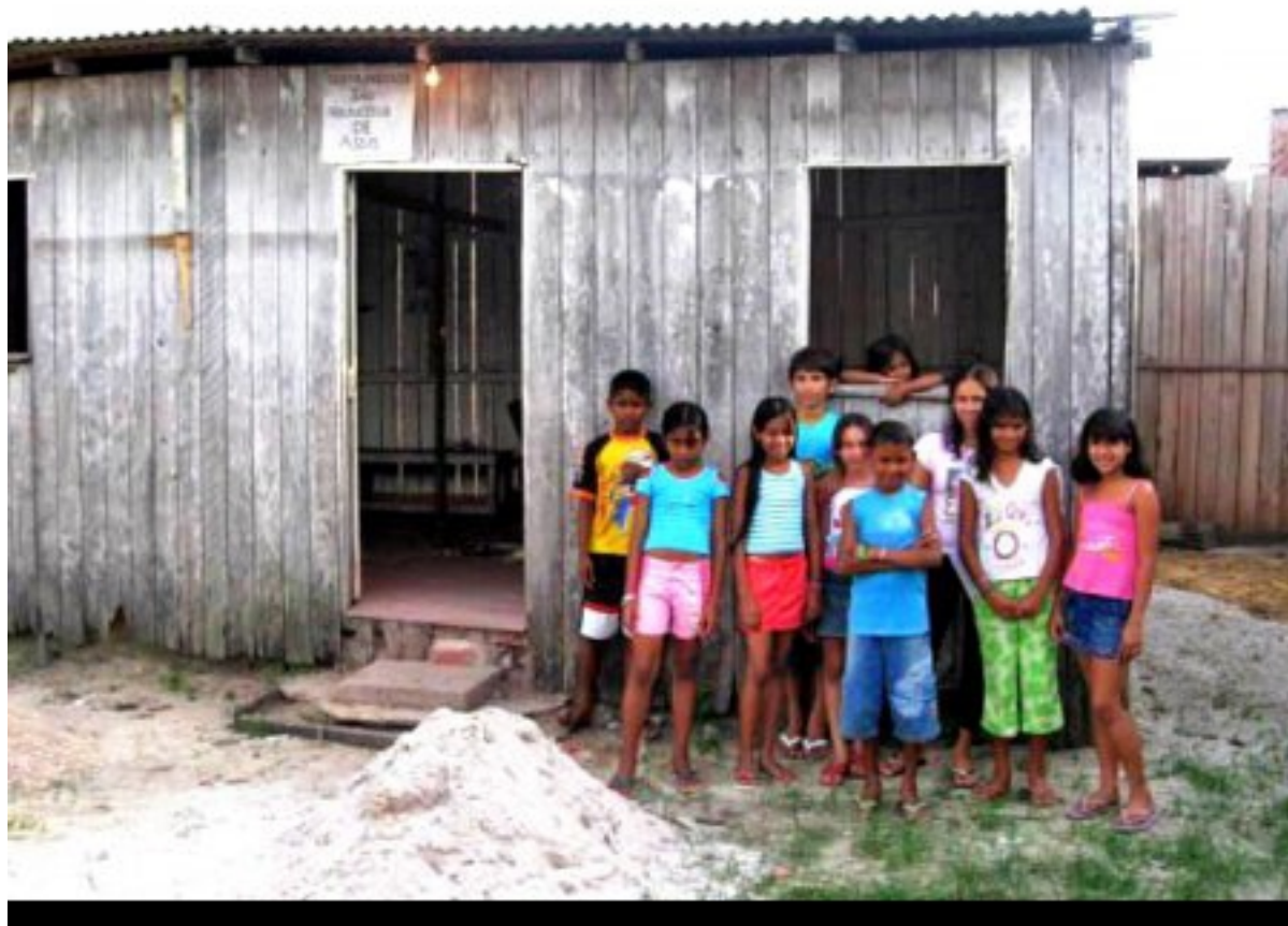
Communitieit Heilige Franciscus. Dit gebouw werd in 2008 gekraakt door 3 families. Inmiddels is het weer in gebruik als communitieit. Tot grote vreugde van de aanwezige kinderen.